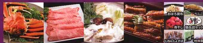
※賞品の写真はイメージです

・越前かに .....2名様 ・若狭ぶぐ鍋セット .....2名様 ・若狭路の特産品 .....50名様 ・三ツ星若狭牛 .....2名様 ・うなぎの蒲焼き .....2名様