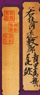
木簡パスポートの裏が朱印帳になっています!

※拝観・観覧した方のみサービスです。 ※各施設、拝観料や観覧料が別途かかる場合があります。 ※特典は、原則、各寺社・施設につき一人一回の利用に限ります。 ※一部、対象外の寺社・施設があります。 ※特典は、数に限りがあります。