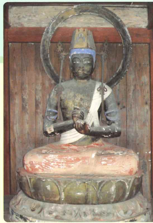
木造大日如来坐像 平安時代11世紀 (小浜市黒駒区所蔵)