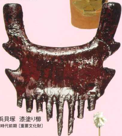
鳥浜貝塚 漆塗り櫛 縄文時代前期 (重要文化財)