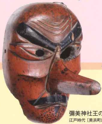
小浜放生祭の 棒振 (複製)