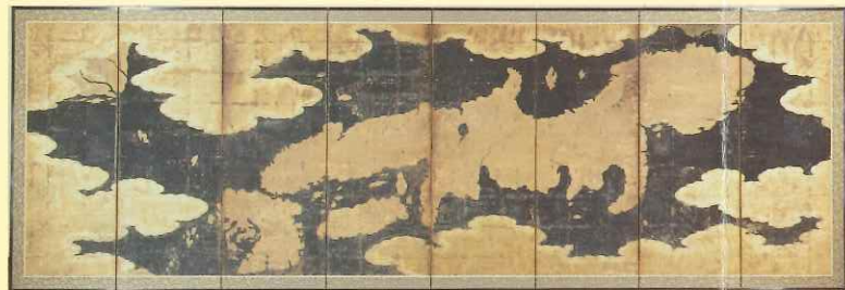
世界及日本図 (当館所蔵)