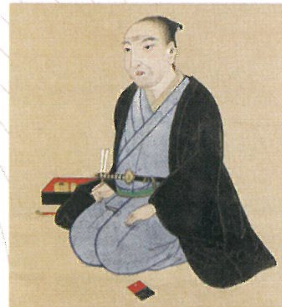
中川淳庵像(部分) 中川家蔵