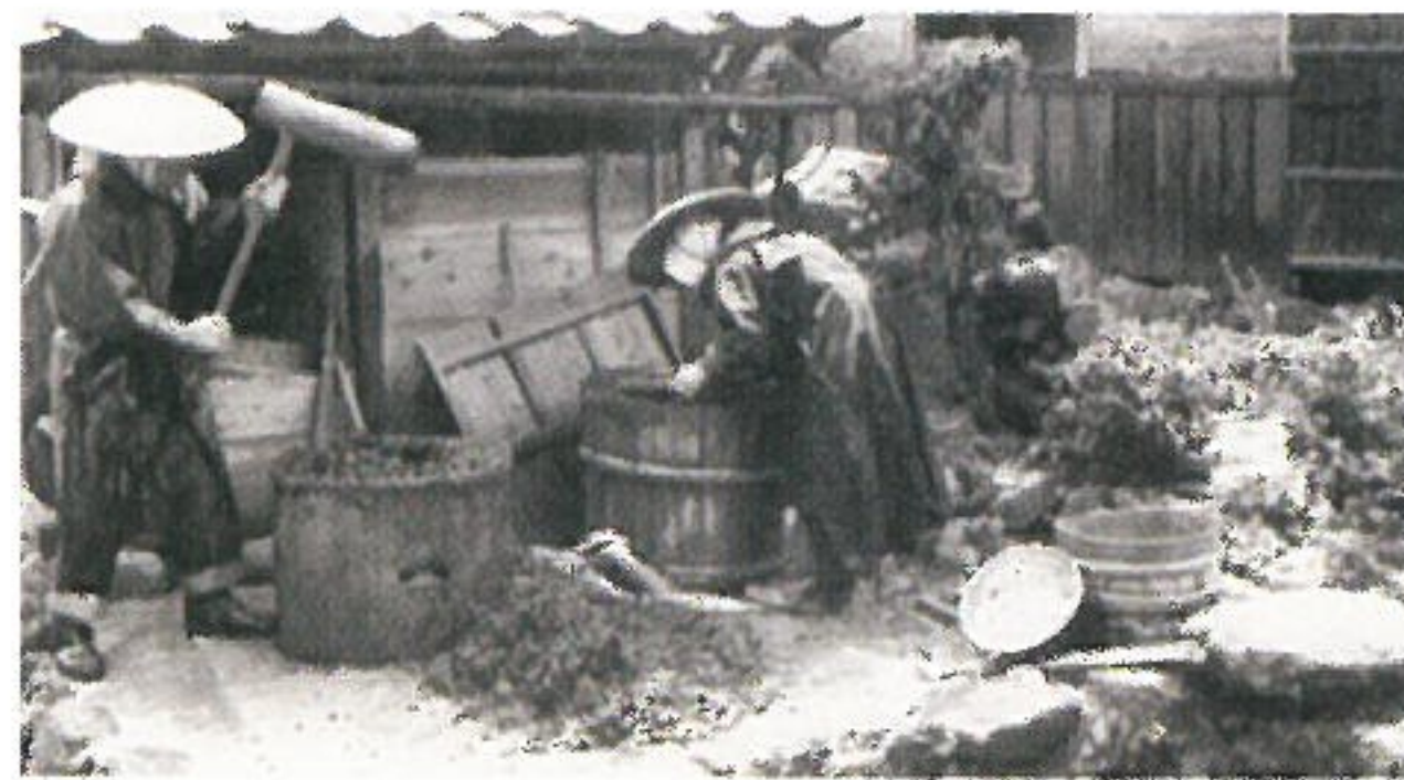
コロビ搦き

かつて若狭の特産であった「ころび」ことアブラギリ(油桐)の生産の様子などについて、紹介します。