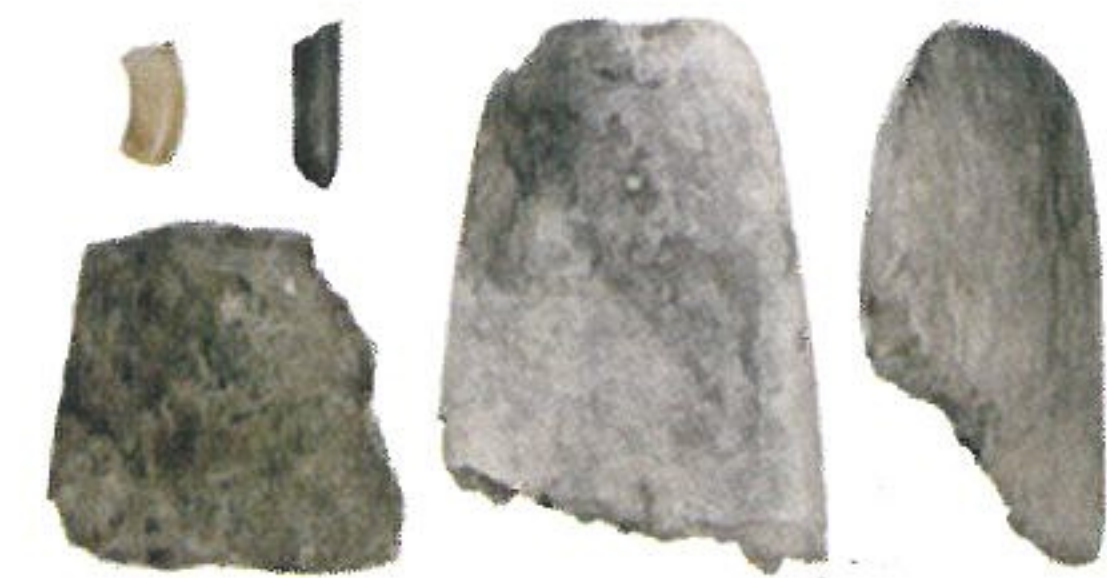
鳥浜貝塚のネフライト

縄文遺跡から出土する石器には、地元で採れたであろう石材のほか遠方の産地の石材が使われていたりします。若狭地方の縄文遺跡の石材事情を紹介します。